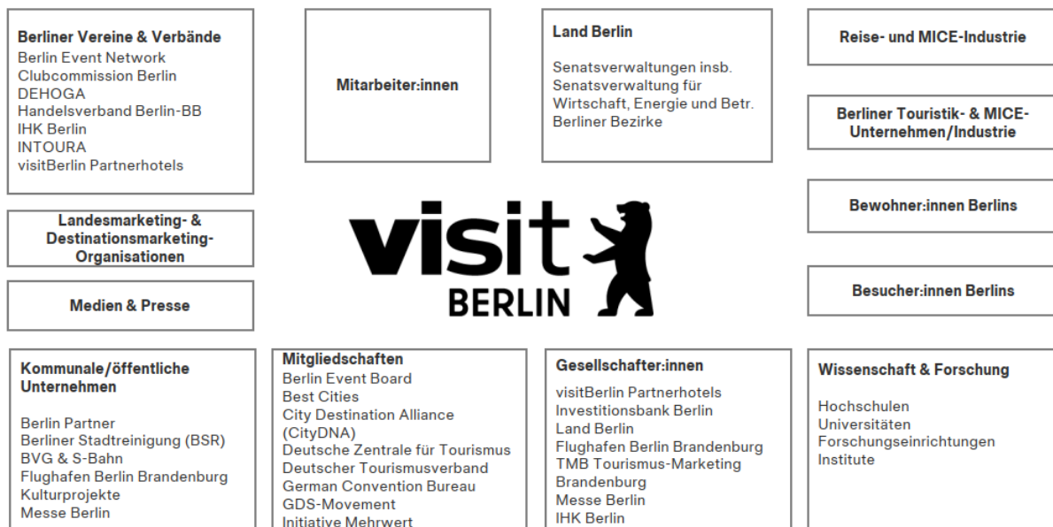
Abbildung 1: Stakeholder der Berlin Tourismus & Kongress GmbH 2025

Gemäß den Unternehmenszielen von visitBerlin liegt der Fokus auf der Förderung eines qualitativ hochwertigen und nachhaltigen Tourismus. Die Definition, Ausgestaltung und Umsetzung dieses Qualitätstourismus erfolgt in enger Zusammenarbeit mit relevanten Stakeholdern entlang der touristischen Wertschöpfungskette. Dazu zählen insbesondere touristische Leistungsträger und Partner der Berliner Visitor Economy (z. B. Beherbergung, Kultur, Attraktionen, Gastronomie, Mobilitätsanbieter und Einzelhandel, öffentliche Institutionen und Verwaltung, Wirtschafts- und