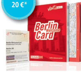
*Preis für 2019